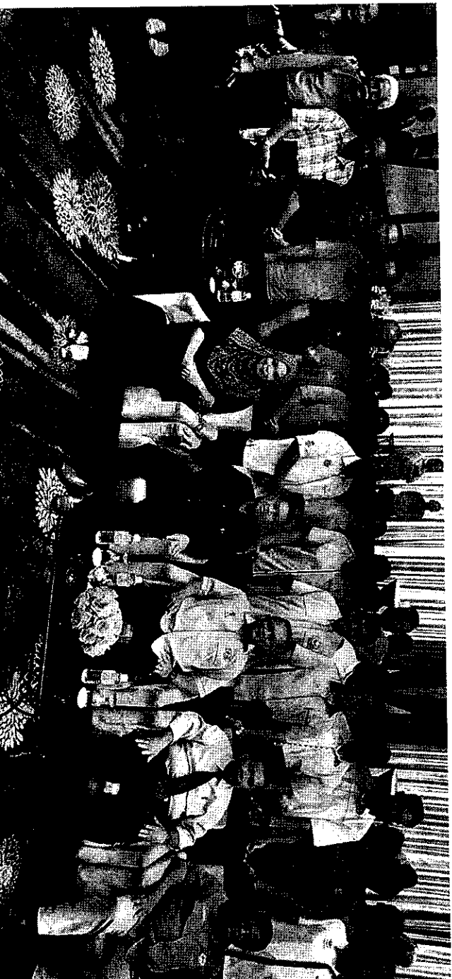
HADIRIN yang hadir merakamkan gambar kenangan bersama tetamu kehormat.

“Kerjasama semua jabatan kerajaan melalui NBOS ini membolehkan seseorang jabatan kerajaan atau agensi lain membantu dan berganding bahu melaksanakan sesuatu program yang dibuat.”